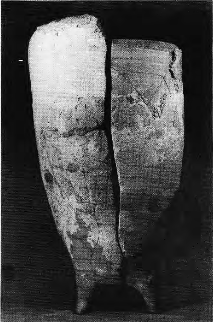
Afb.2. Een gerestaureerde pijpenpot uit Gorinchem, die verhoogd is met een opzetstuk. (Collectie:F.Kneefel)